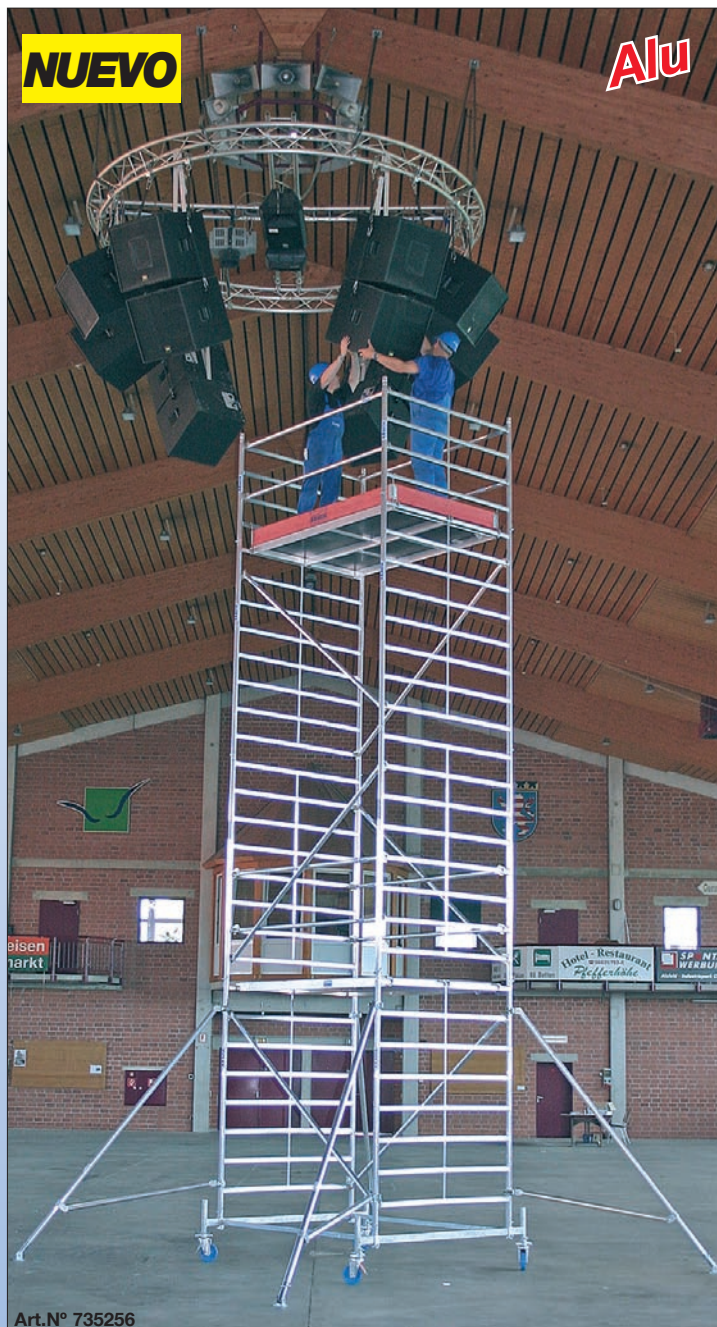
Art. No. 735256

Encontrará piezas de sistema a partir de la página 84.