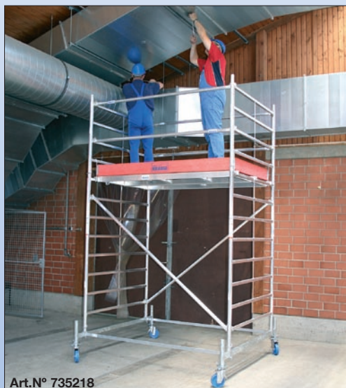
Art. No. 735218